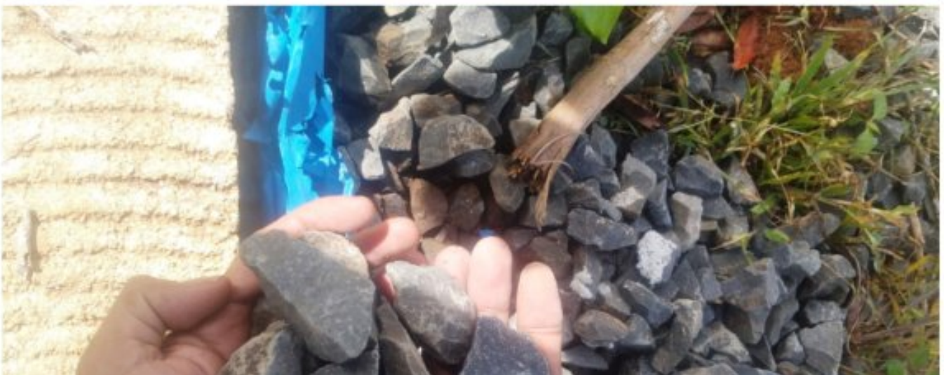
Rabat beton pekon batu kabayan

Lampung Barat - Pelaksanaan pembangunan jalan rabat beton dengan ukuran panjang 53,3 meter lebar 2 meter dan tebal 15 cm yang berlokasi di pekon batu kabayan kec. batu tulis kabupaten lampung barat yang bersumber dari dana